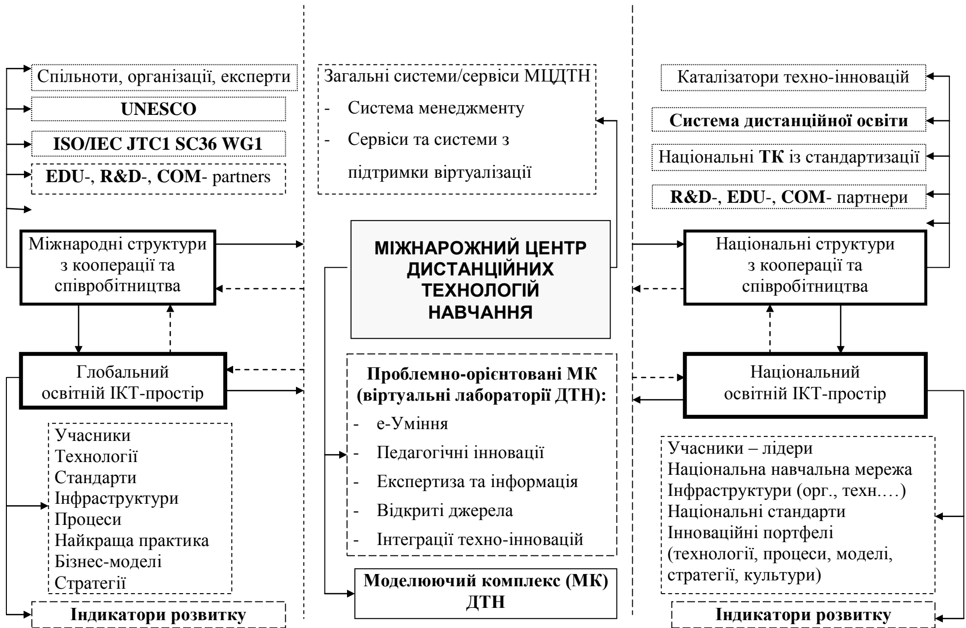
Рис. 2 Міжнародний центр дистанційних технологій навчання (МЦДТН) – Загальна структура